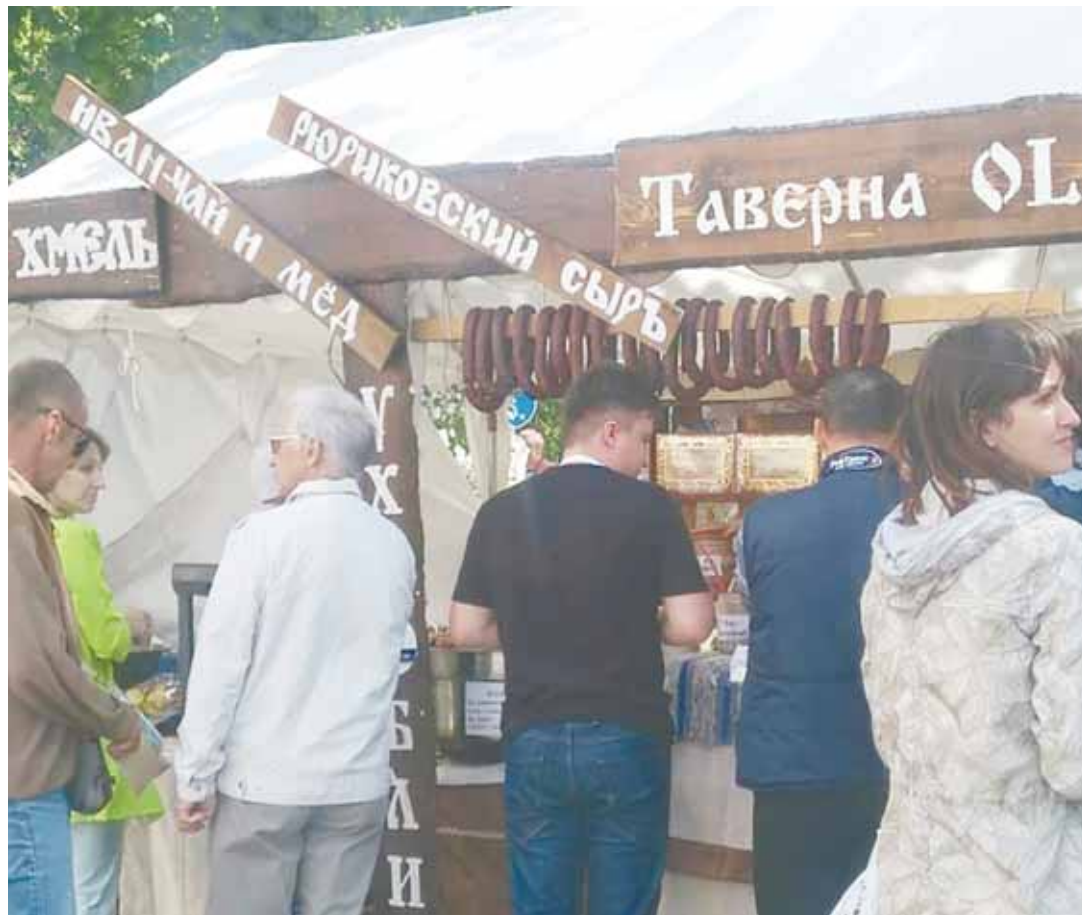
Во время Ганзы «иностранцы были нацелены пить пиво и есть колбаски».