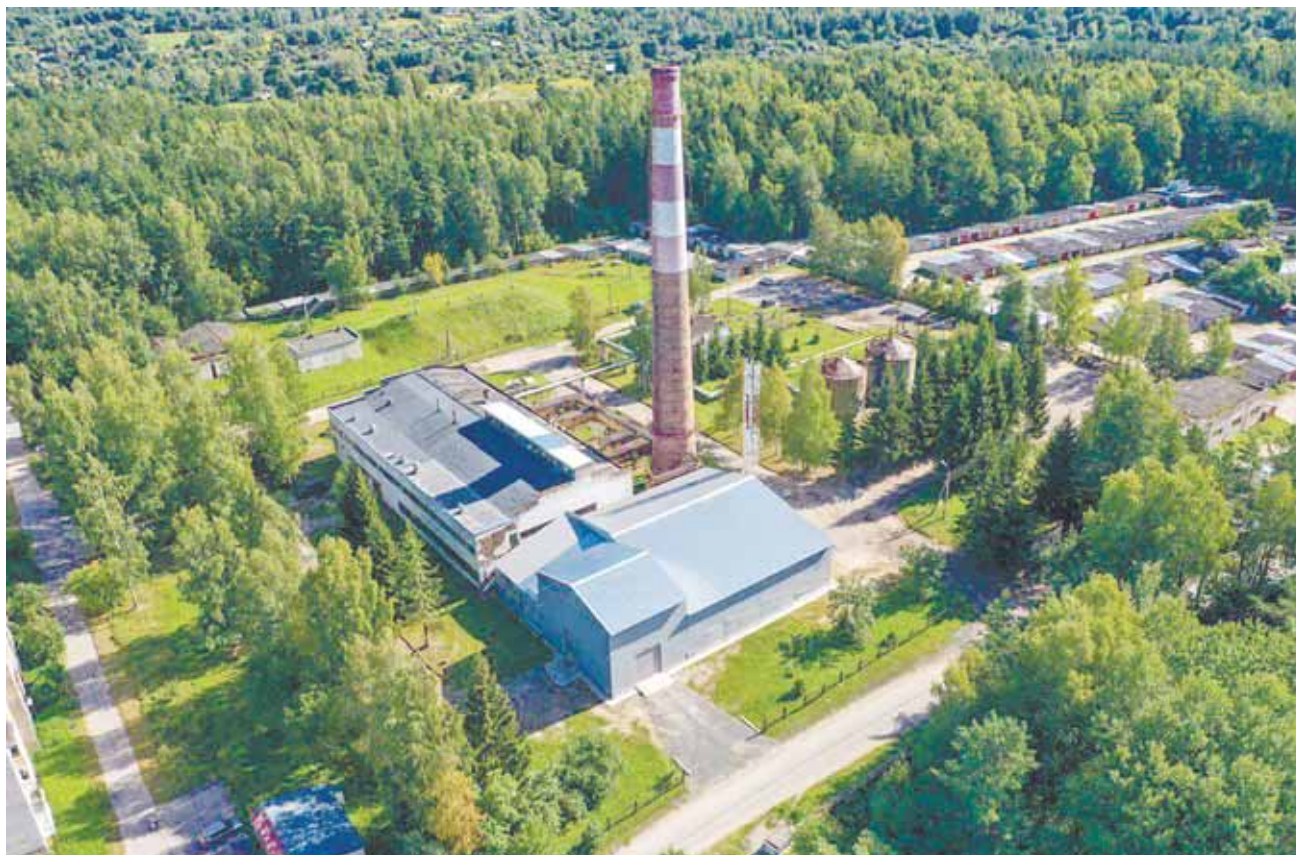
Котельная МП ЖКХ Пушкиногорского района.