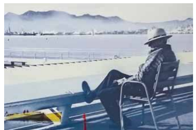
Фотография с выставки «Был и я в стране чудесной...»

ПСКОВСКАЯ ГУБЕРНИЯ Выходит в свет с августа 2000 года