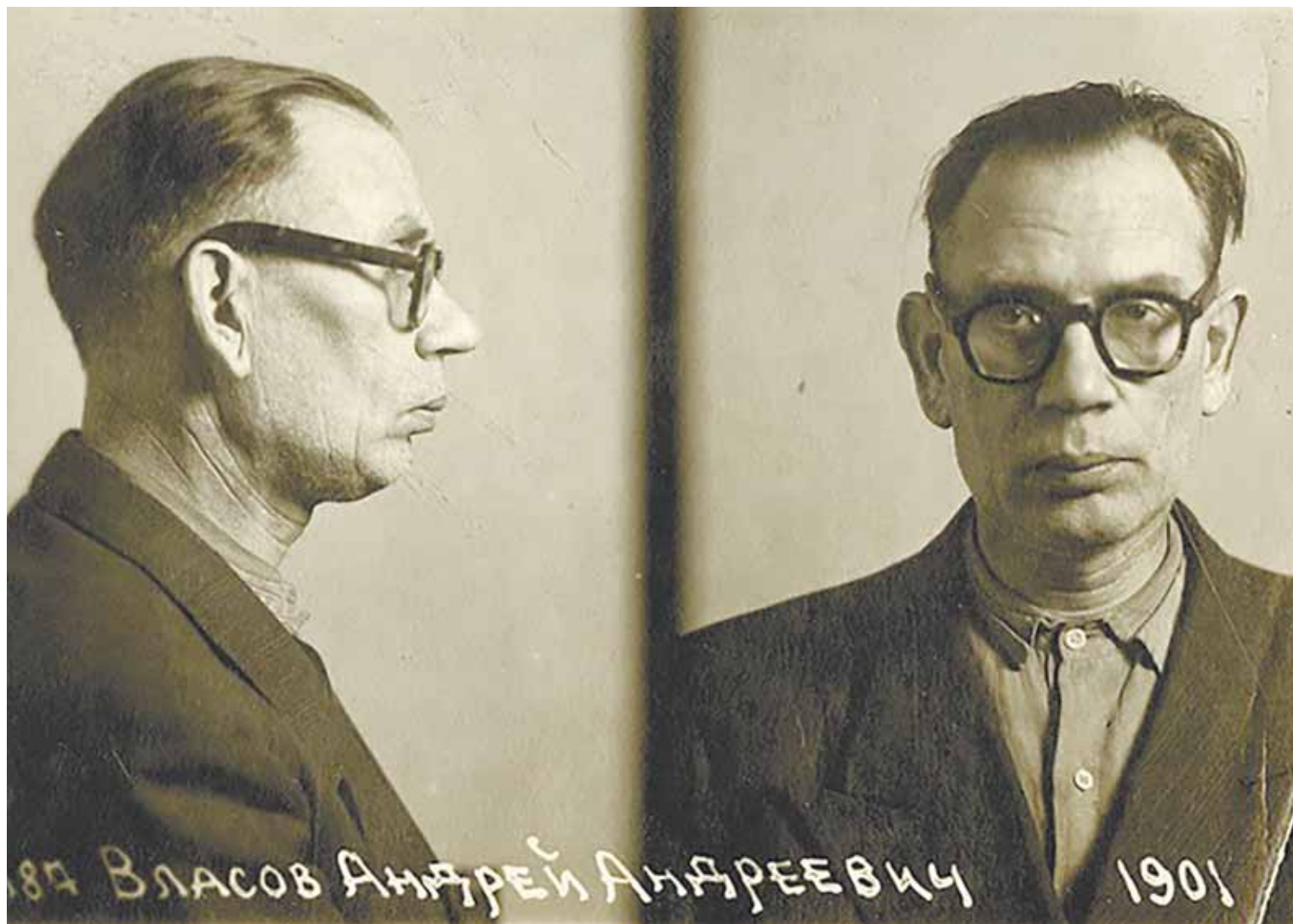
Генерал-лейтенант Андрей Власов.