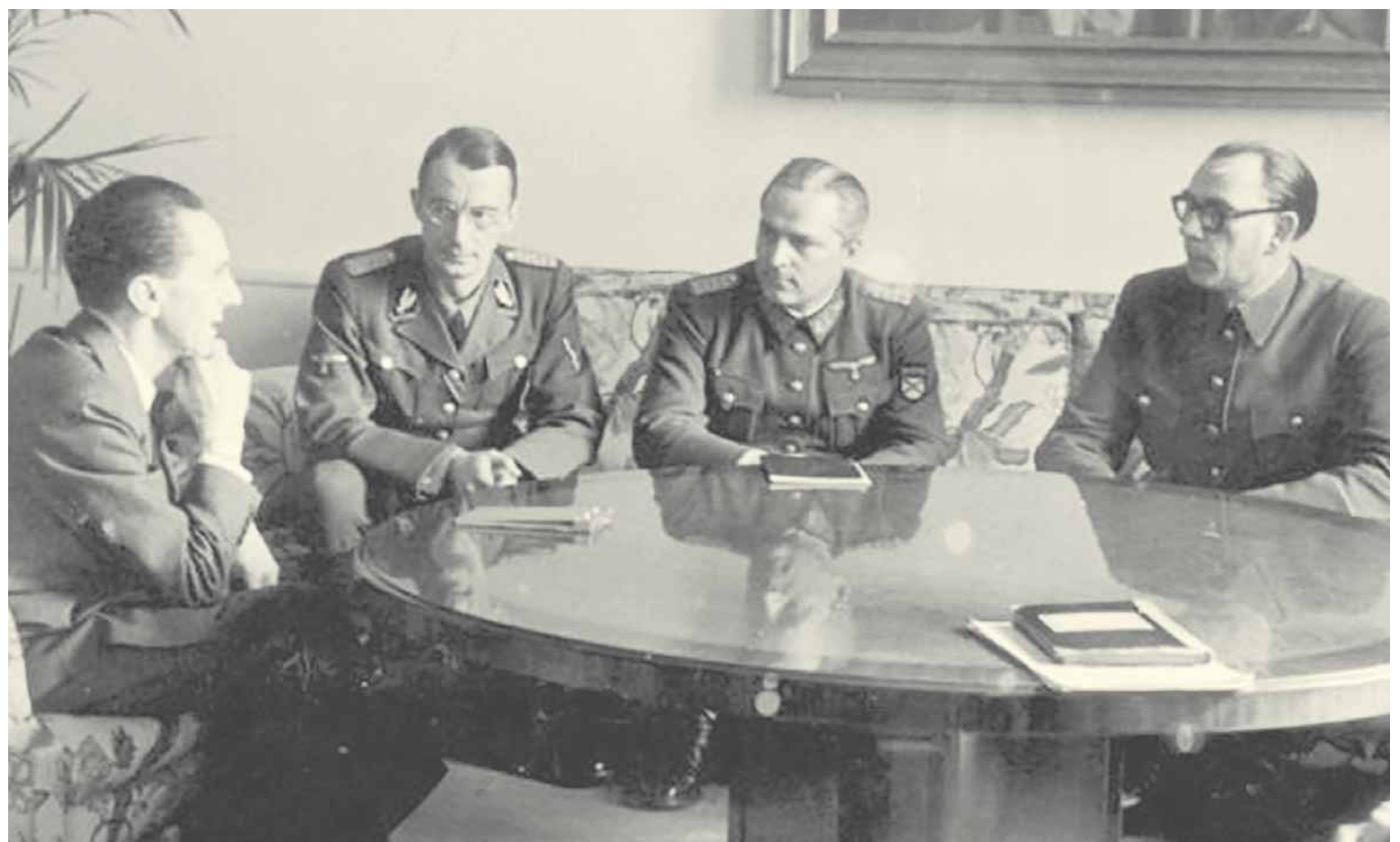
Генерал-лейтенант Андрей Власов на встрече с рейхсминистром народного просвещения и пропаганды Германии Йозефом Геббельсом.