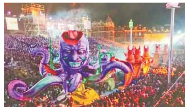
Фотография с выставки «Был и я в стране чудесной...»

Ницца напоминает того таинственного и победоносного Г. На фотографиях, представленных в Пскове, Ницца тоже выглядит уверенно (даже самоуверенно). Она капризна, фатовата, но совсем не жестока. Кто-то из посетителей сказал, что она однообразна. В том смысле, что нам показали только парадную часть. Предложили любоваться её предсказуемой прибрежной красотой.