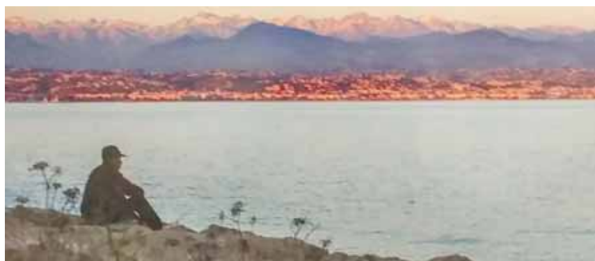
Фотография с выставки «Был и я в стране чудесной...»