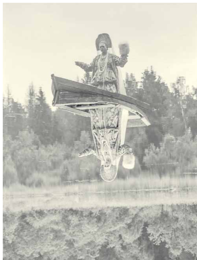
Кадр из фильма «Мешок без дна».

И всё же кажется, что Хамдамов, помимо всего прочего, вдохновлялся советскими киносказками Александра Роу . Но, в отличие от Роу, о зрителях он совсем не беспокоился. Он поставил сказку в своём стиле – для взрослых. Для узкого круга взрослых, которых можно перечислить поимённо.