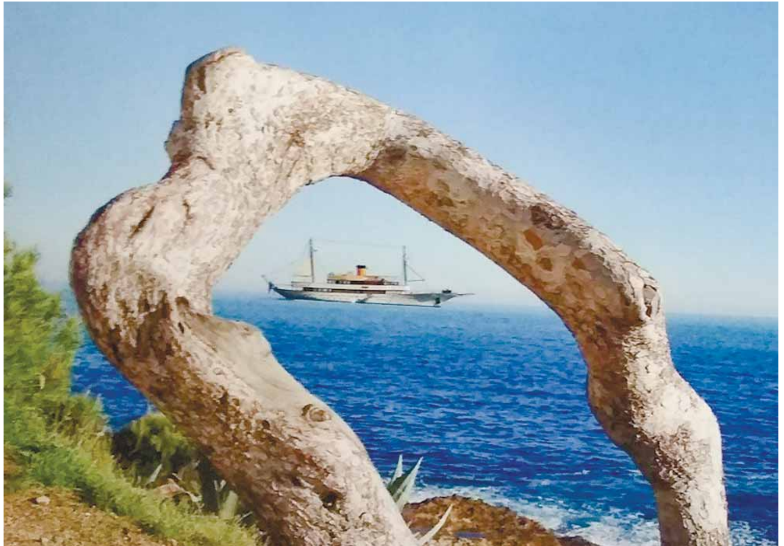
Фотография с выставки «Был и я в стране чудесной...»

За полторы сотни лет в этом смысле мало что изменилось. Но, наверное, один из самых известных русских памятников – не храм и не вилла. Он нематериален. Это дневник юной Марии Башкирцевой , написанный в Ницце в позапрошлом веке на вилле Aqua-Viva . В нём есть такие слова: «Человек бедный теряет половину своего достоинства; он кажется маленьким, жалким, имеет вид какой-то пешки. Тогда как человек богатый, независимый полон гордого покоя. Уверенность всегда имеет в себе нечто победоносное, и я люблю в Г. этот вид – уверенный, капризный, фатоватый и жестокий».