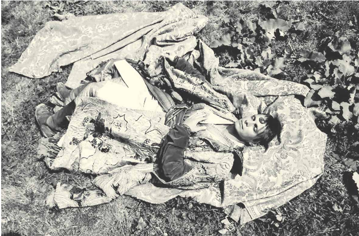
Кадр из фильма «Мешок без дна».