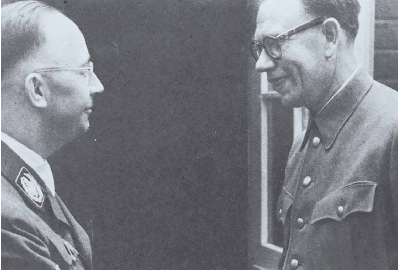
Генерал-лейтенант Андрей Власов на встрече с рейхсминистром внутренних дел Германии Генрихом Гиммлером.

исполняют в России до сих пор. «Марш вперёд, железными рядами // В бой за Родину, за наш народ! // Только вера двигает горами, // Только смелость города берёт!» Правда, у власовцев была другая задача. Города брали (а потом сдавали) немцы, а РОА в основном существовала для пропаганды.